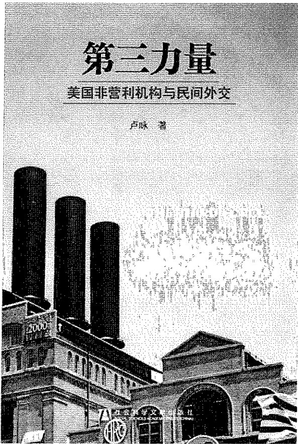
美国模式?中国道路?

新闻中心-中国网 news.china.com.cn 时间: 2011-04-11 责任编辑: 李东