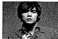
全球流行音乐金榜 周...